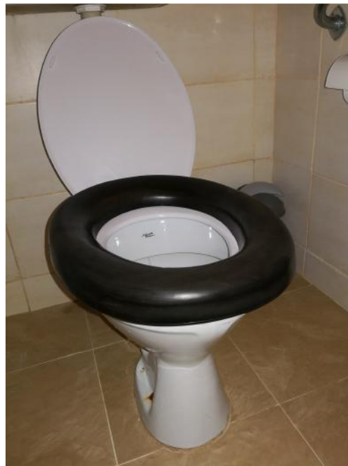
Ein Toilettensitz aus Kunststoff (Sitzhöhe 500mm) und zwei Softsitze (Sitzhöhe 500 und 450mm Höhe)